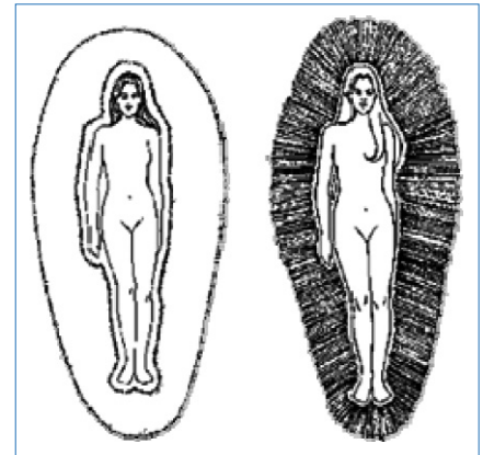
Abb. 1: Die Gesundheitsaura

Das Wort Chakra stammt aus dem altindischen Sanskrit und bedeutet „Rad“. Alte Yogaschriften sprechen von 88.000 Chakren, wir fokussieren uns auf die sieben Hauptchakren, die entlang der vertikalen Achse des menschlichen Körpers aufgereiht sind. Zwischen dem untersten (Wurzel-) Chakra und dem obersten (Scheitel-) Chakra besteht eine dynamische energetische Verbindung, die in der indischen Tradition Kundalini und in der westlichen Kultur Lebenslinie genannt wird. 3 Die Kundalini-Kraft bewegt sich in drei vertikalen Energie-